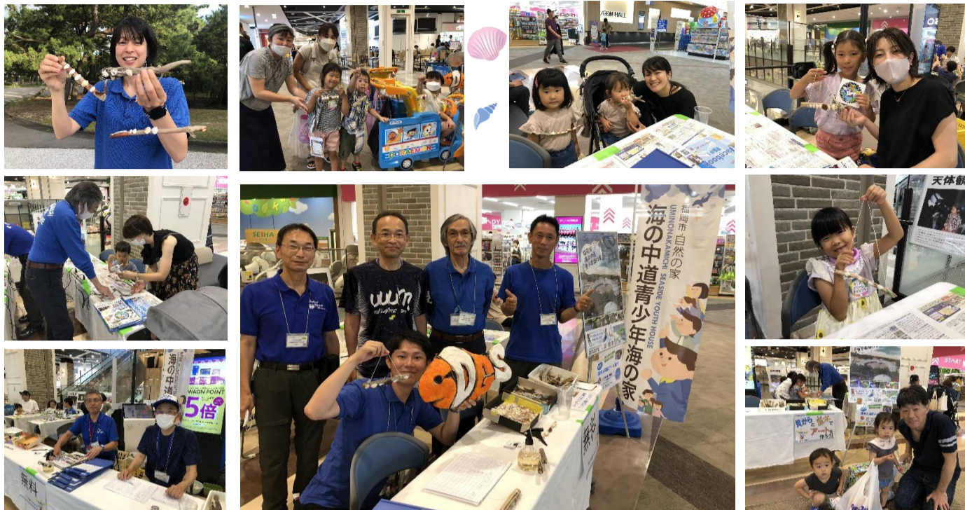
★イオンモール筑紫野さんでクラフト制作ブース出展★